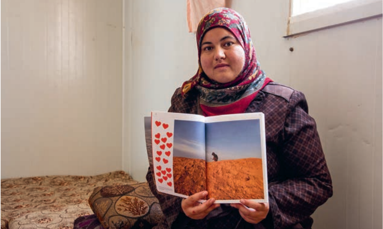
Nareeman valokuvaa elämää Za'atarin pakolaisleirissä.